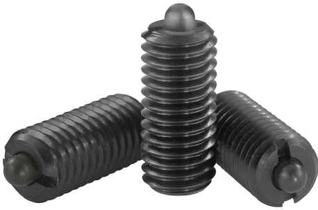
스프링 플런저 사용 예