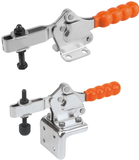
프런트측 조립용 앵글 브라켓 (액세서리 참조).